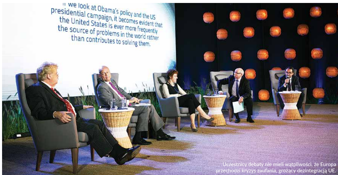
Uczestnicy debaty nie mieli wątpliwości, że Europa przechodzi kryzys zaufania, grożący dezintegracją UE.

debaty, gdyż nie ma na to czasu – mówił. Przestrzegając przed przeciwstawianiem sobie Unii Europejskiej i państw narodowych.