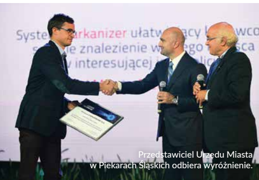
Przedstawiciel Urzędu Miasta w Piekarach Śląskich odbiera wyróżnienie.

Od sześciu lat NEW@POLAND promuje działania na rzecz rozwoju społeczeństwa informacyjnego i technologicznej innowacyjności, wyróżniając projekty, które zmieniają sposób organizacji państwa i oferowania usług publicznych.