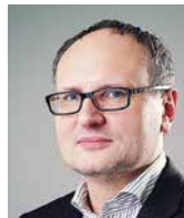
PAWEŁ LISICKI redaktor naczelny, „Do Rzeczy”, Polska