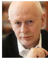
MICHAŁ BONI europoseł, Parlament Europejski