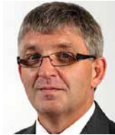
JACEK KRAWCZYK przewodniczący Grupy Pracodawców, Europejski Komitet Ekonomiczno-Społeczny (EKES)