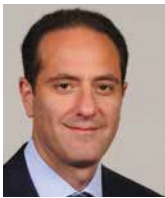
MICHEL KHALAF prezes, MetLife EMEA, USA