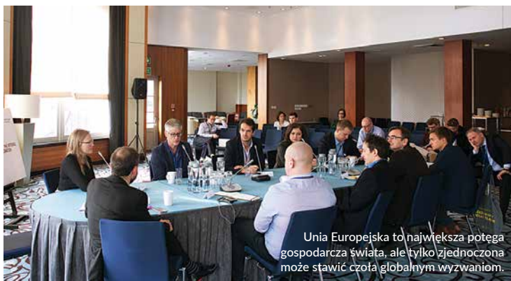
Unia Europejska to największa potęga gospodarcza świata, ale tylko zjednoczona może stawić czoła globalnym wyzwaniom.

MAREK TEJCHMAN , zastępca redaktora naczelnego, „Dziennik Gazeta Prawna”, Polska