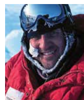
MAREK KAMIŃSKI przedsiębiorca i podróżnik, Polska