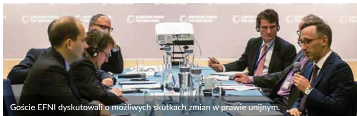
Goście EFNI dyskutowali o możliwych skutkach zmian w prawie unijnym.