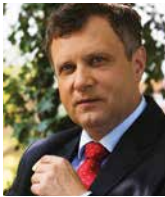
JACEK KARNOWSKI prezydent Sopotu, Polska