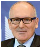
FRANS TIMMERMANS pierwszy wiceprzewodniczący Komisji Europejskiej