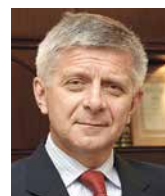
MAREK BELKA b. premier RP, Polska