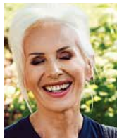
OLGA (KORA) SIPOWICZ wokalistka rockowa i autorka tekstów, Polska