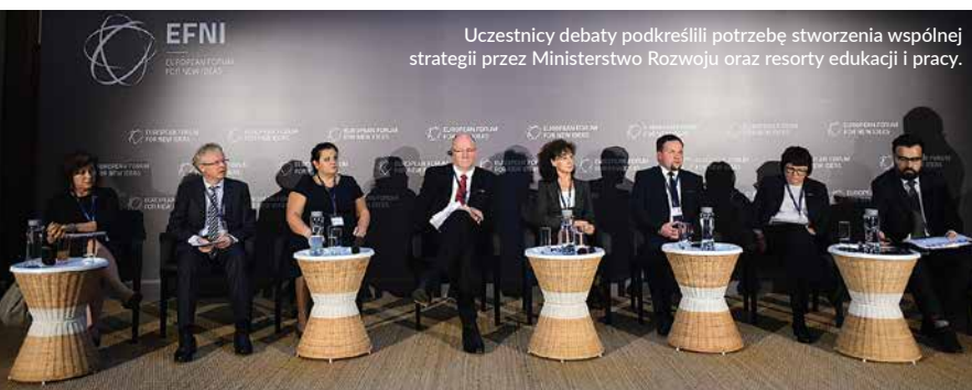
Uczestnicy debaty podkreślili potrzebę stworzenia wspólnej strategii przez Ministerstwo Rozwoju oraz resorty edukacji i pracy.