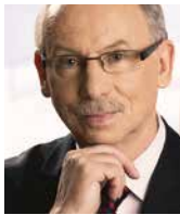
JANUSZ LEWANDOWSKI europoseł, Parlament Europejski