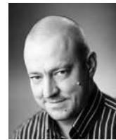
UGIS LIBIETIS korespondent międzynarodowy, Latvian Radio, Łotwa