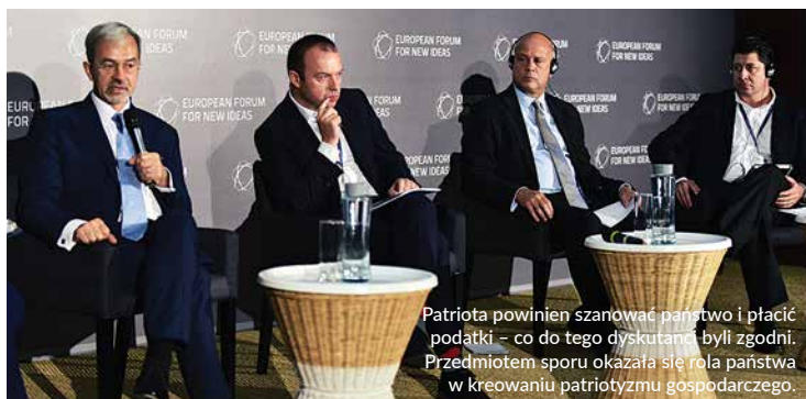
Patriota powinien szanować państwo i płacić podatki – co do tego dyskutanci byli zgodni. Przedmiotem sporu okazała się rola państwa w kreowaniu patriotyzmu gospodarczego.