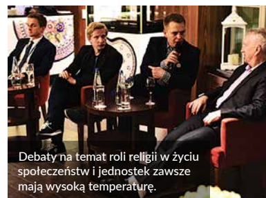
Debaty na temat roli religii w życiu społeczeństw i jednostek zawsze mają wysoką temperaturę.