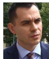
PIOTR KRASUSKI dyrektor Departamentu Europejskiego Funduszu Społecznego, Ministerstwo Rozwoju, Polska