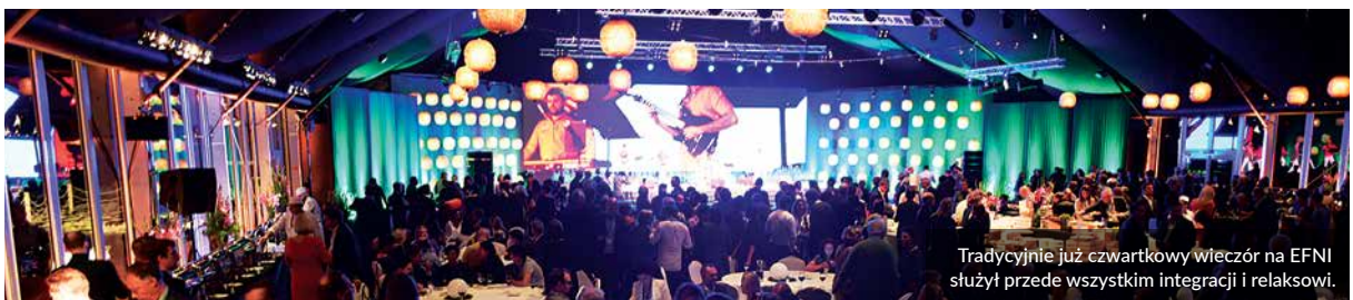
Tradycyjnie już czwartkowy wieczór na EFN służył przede wszystkim integracji i relaksowi.

Tego wieczoru Pawilon Nowych Idei zmienił swój oficjalny charakter. Na środku pojawiła się duża „wyspa” włoskich przysmaków, a wśród nich słynny włoski ser Grana Padano, słodczyce Ferrero, czekoladki Amedei, panettone Fiasconero, taralli Apulia Food oraz inne specjały. Serwowano włoskie wina grappa Marzardo i znakomitą kawę Vergano. Przez przeszklone ściany widać było zatokę i oświetlone sopockie moło, a z drugiej strony hotele Grand i Sheraton.