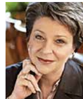
IRENA ERIS założycielka, dyrektor ds. badań i rozwoju, Laboratorium Kosmetyczne Dr Irena Eris, Polska