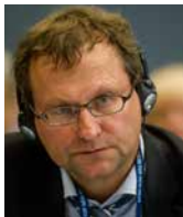
MANFRED HUTERER minister pełnomocny Ambasady Niemiec w Polsce