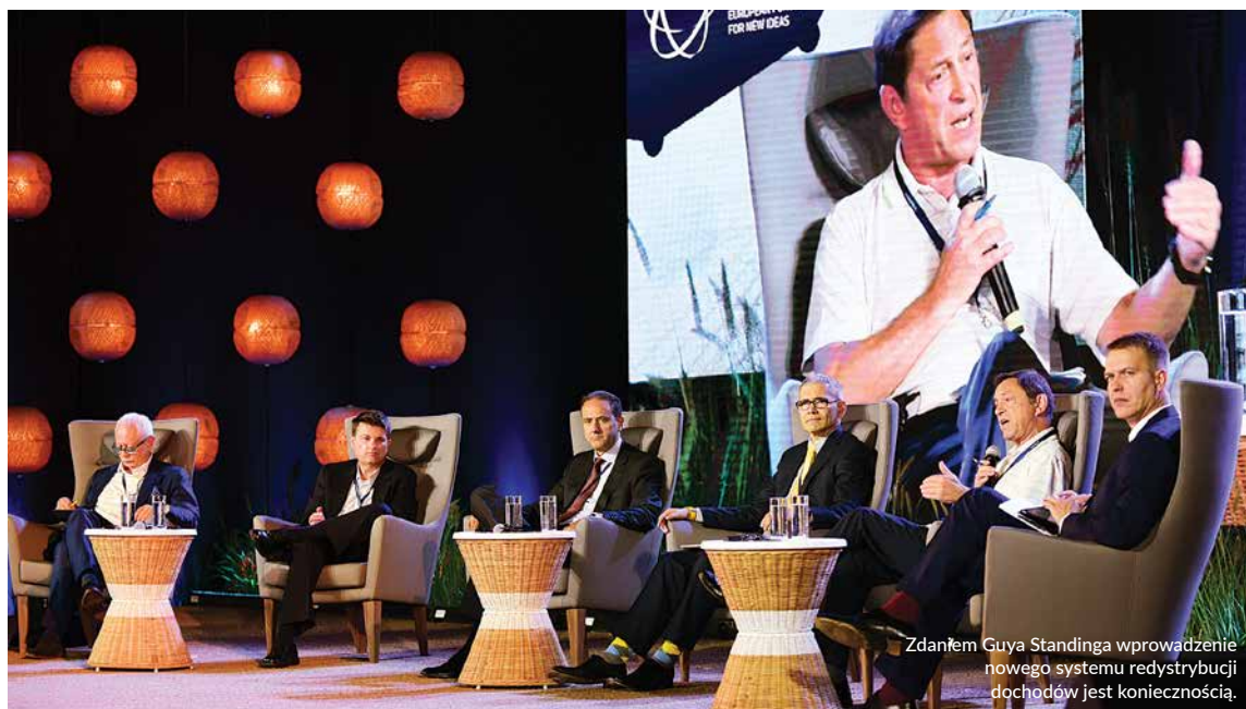
Zdaniem Guya Standinga wprowadzenie nowego systemu redystrybucji dochodów jest koniecznością.

poczucia bezpieczeństwa. – Miliony ludzi stoją w obliczu niepewnej pracy i niższych dochodów. Tracą swoje prawa – ekonomiczne, obywatelskie, polityczne. To prawdziwy kryzys – podkreślał Standing. – Jednak to nie biznes jest odpowiedzialny za powstanie prekariatu – przekonywał. Wynika on z nieuchronnego procesu rozwoju technologii i zmian systemowych.