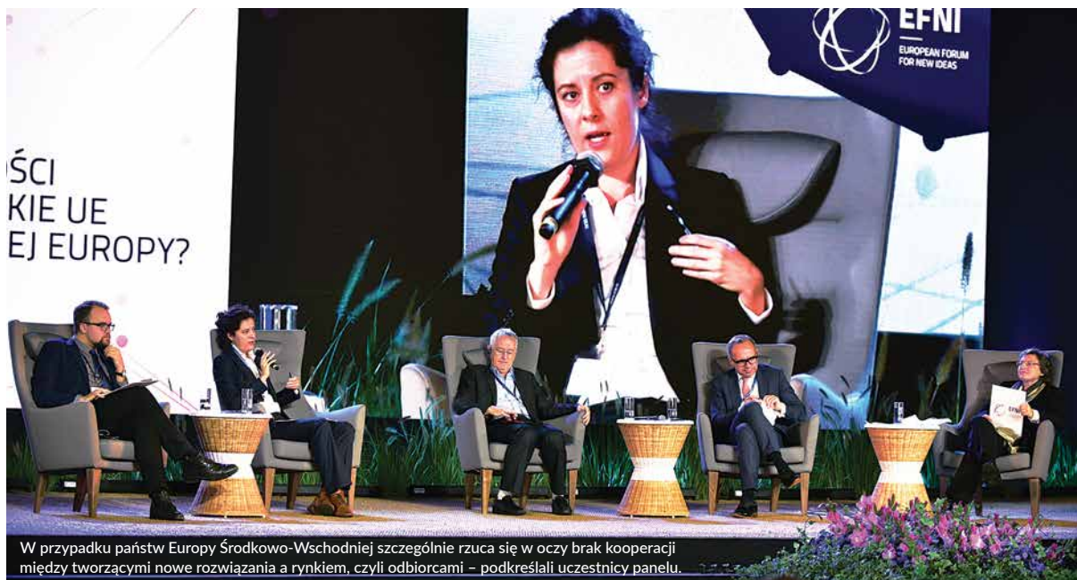
W przypadku państw Europy Środkowo-Wschodniej szczególnie rzuca się w oczy brak kooperacji między twórcami nowe rozwiązania a rynkiem, czyli odbiorcami – podkreślali uczestnicy panelu.

naukowe i innowacje, podkreślając znaczenie kontynuowania inwestycji w tym obszarze. Z danych Komisji Europejskiej wynika, że pod względem innowacyjności UE dogania Japonię i USA. W przypadku państw Europy Środkowo-Wschodniej rzuca się w oczy brak kooperacji między tymi, którzy tworzą nowe rozwiązania, a rynkiem.