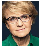
DANUTA HÜBNER przewodnicząca Komisji Spraw Konstytucyjnych, Parlament Europejski