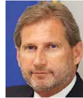
JOHANNES HAHN komisarz UE ds. europejskiej polityki sąsiedztwa i negocjacji akcesyjnych, Komisja Europejska