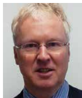
MARTIN KOPPERNOCK attaché ds. społecznych, Ambasada Republiki Federalnej Niemiec w Polsce