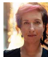
SYLWIA CHUTNIK pisarka, Polska