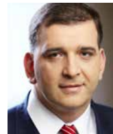
RAFAŁ BANIAK wiceprezydent wykonawczy, Pracodawcy RP, Polska