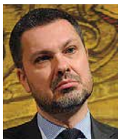
LUCA VISENTINI sekretarz generalny, Europejska Konfederacja Związków Zawodowych (ETUC)