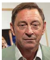
GUY STANDING profesor, Uniwersytet Londyński, Wielka Brytania