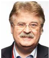
ELMAR BROK przewodniczący, Komisja Spraw Zagranicznych, Parlament Europejski