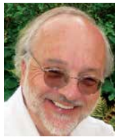
HERBERT KITSCHELT profesor, Uniwersytet Duke, USA