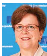
GABRIELE BISCHOFF przewodnicząca Grupy Pracowników, Europejski Komitet Ekonomiczno- Społeczny (EKES)