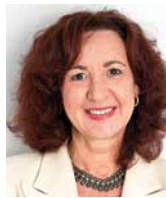
ANNEMARIE MUNTZ prezydent World Employment Confederation