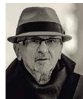
TOMASZ STAŃKO muzyk, Polska