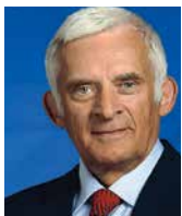
JERZY BUZEK przewodniczący Rady Programowej EFNI, przewodniczący Komisji Przemysłu, Badań Naukowych i Energii, Parlament Europejski