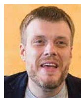
ADRIAN ZANDBERG członek zarządu, partia Razem, Polska