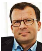
MARCIN ZIELENIECKI podsekretarz stanu i wiceminister, Ministerstwo Rodziny, Pracy i Polityki Społecznej, Polska