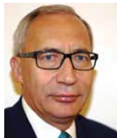
KAZIMIERZ SMOLIŃSKI sekretarz stanu, Ministerstwo Infrastruktury i Budownictwa, Polska