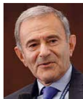
ANDRZEJ LUBOWSKI ekonomista i niezależny dziennikarz, USA