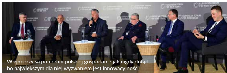
Wizjonerzy są potrzebni polskiej gospodarce jak nigdy dotąd, bo największym dla niej wyzwaniem jest innowacyjność.

pięciolecia. – Żeby zrobić biznes, trzeba być artystą i mieć intuicję. Wiedzieć, kiedy zrobić krok do przodu, a kiedy do tyłu. Prowadzenia biznesu nie da się nauczyć. Książki mogą wskazywać nam drogę, ale nie nauczą nas, jak to zrobić. W elektronice zmiany są ogromne i ciągłe. Niedawno nawet nam się nie marzyło dzisiejsza wydajność laptopów. Zmiany musimy przewidywać i prognozować, a nawet programować – przekonywał.