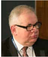
KRZYSZTOF SZERKUS pełnomocnik Terenowego Rzecznika Praw Obywatelskich w Gdańsku, Polska