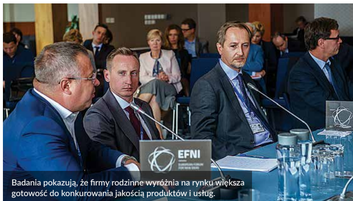
Badania pokazują, że firmy rodzinne wyróżnia na rynku większa gotowość do konkurowania jakością produktów i usług.

Otwarcie na innowacje – czy możliwa jest droga na skróty? Co powinna zawierać strategia odpowiedzialnego rozwoju, by wesprzeć ekspansję firm rodzinnych? Na te i inne pytania odpowiadali uczestnicy debaty, którzy zastanawiali się także nad tym, jak włączać sukcesorów w zarządzanie firmą.