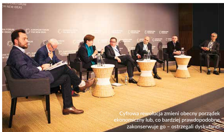
Cyfrowa rewolucja zmieni obecny porządek ekonomiczny lub, co bardziej prawdopodobne, zakonserwuje go – ostrzegali dyskutanci.

Jak sztuczna inteligencja wpłynie na jakość pracy? Jak rozwijać biznes w realiach skokowej cyfryzacji i mobilności? Na te pytania odpowiadali uczestnicy panelu, zastanawiając się nad wpływem cyfrowej rewolucji na porządek ekonomiczny.