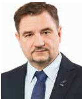
PIOTR DUDA przewodniczący Rady Dialogu Społecznego, przewodniczący NSZZ „Solidarność”, Polska