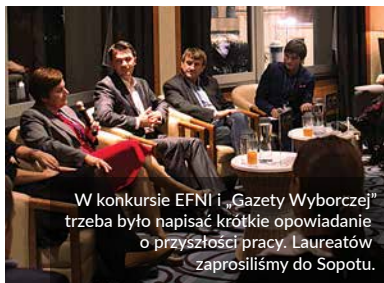
W konkursie EFNI i „Gazety Wyborczej” trzeba było napisać krótkie opowiadanie o przyszłości pracy. Laureatów zaprosiliśmy do Sopotu.