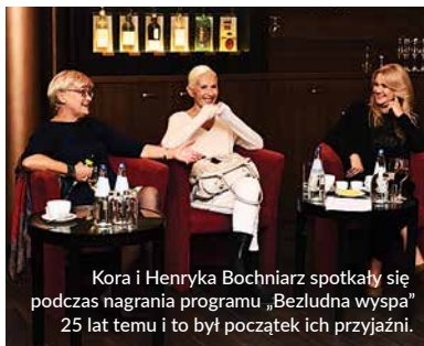
Kora i Henryka Bochniarz spotkały się podczas nagrania programu „Bezludna wyspa” 25 lat temu i to był początek ich przyjaźni.

– Przyjaźń to miłość, którą mierzy się czasem. Jeśli spotkam się z moją przyjaciółką po kilku latach, ale jest tak intensywnie, jakby to było wczoraj, to wiem, że to jest przyjaźń – mówiła wokalistka rockowa i autorka tekstów Olga Sipowicz (Kora) . Z kolei Henryka Bochniarz , wiceprezydent BusinessEurope i prezydent Konfederacji Lewiatan, w przyjaźni szuka inspiracji, a przyjaciele