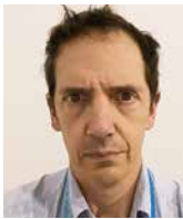
MATTHEW DAY korespondent na Europę Wschodnią i Rosję, „The Telegraph”, Wielka Brytania