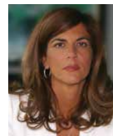
EMMA MARCEGAGLIA prezydent, BusinessEurope