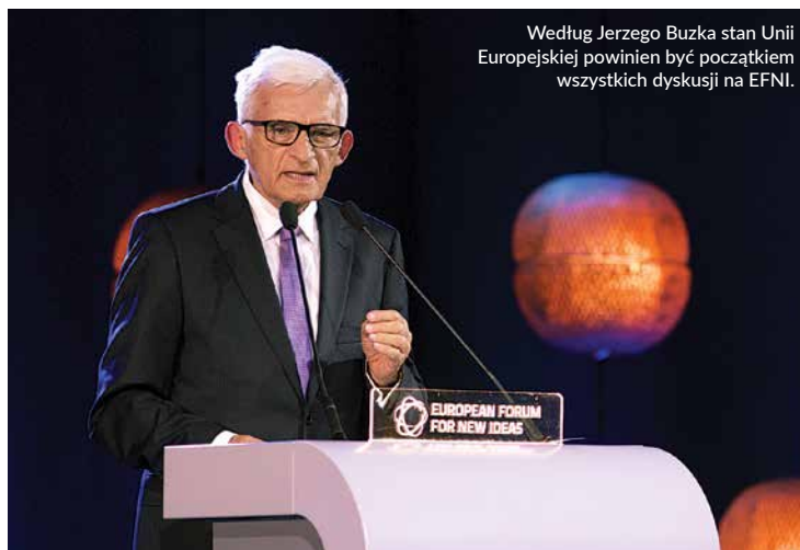
Według Jerzego Buzka stan Unii Europejskiej powinien być początkiem wszystkich dyskusji na EFNI.