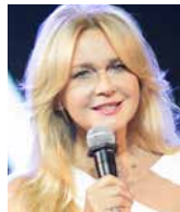
GRAŻYNA TORBICKA dziennikarka, Polska