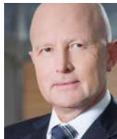
ANDRZEJ KLESYK b. prezes zarządu PZU, Polska