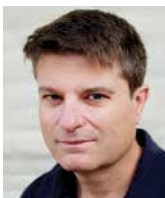
MARTIN FORD futurológ i przedsiębiorca, USA