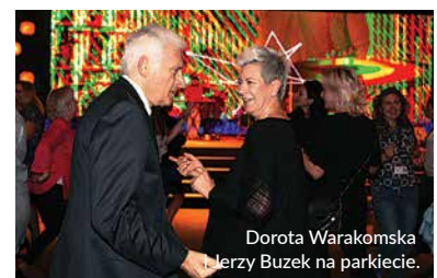
Dorota Warakomska i Jerzy Buzek na parkiecie.