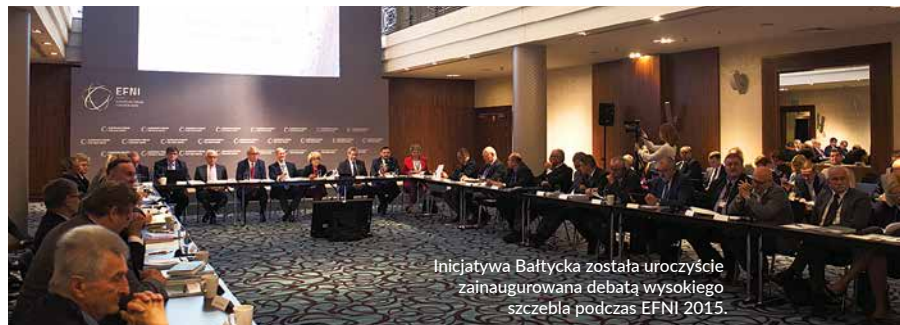
Inicjatywa Bałtycka została uroczystie zainaugurowana debatą wysokiego szczebla podczas EFNI 2015.

Podczas spotkania rozmawiano nt. zrównoważonego rozwoju regionu Morza Bałtyckiego, śródlądowych dróg wodnych w ramach międzynarodowych korytarzy transportowych oraz transportu intermodalnego. Rozmawiano także o dbałości o bałtycki ekosystem i ewolucji portów.